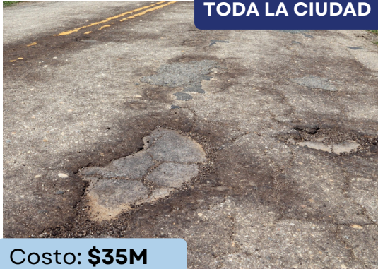
TODA LA CIUDAD