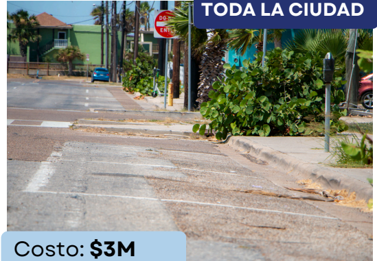
TODA LA CIUDAD

Repavimentación de calles residenciales seleccionadas del Programa de Gestión de Infraestructura de 5 años aprobado por la Ciudad.